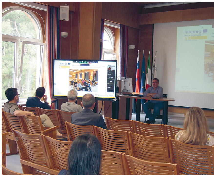
Partnerji pravkar sklenjenega čezmejnega projekta IMBI bodo sodelovali še naprej s ciljem vpeljati zdravljenje sklepnih okužb z bakteriofagi takrat, ko antibiotiki odpovedo, so med drugim sklenili ob koncu projekta minuli petek in se spomnili tudi prvega srečanja januarja leta 2020.

Hkrati OBV v okviru drugega projekta, ki sočasno poteka, s pomočjo modela poskusa na živalih prav tako intenzivno raziskuje možnost zdravljenja tovrstnih okužb s pomočjo bakteriofagov. Ob tem sogovornik dodaja: “Glede na to, da postaja rezistenca na antibiotike velik globalni problem, so bakteriofagi ena od možnih rešitev. Tako si prizadevamo z raziskovalnim delom postaviti temelje, na podlagi katerih bomo odločevalce lahko zaprosili za dovoljenja, da pričnemo z zdravljenjem takih bolnikov zlasti, ko bodo antibiotiki ne-močni.”